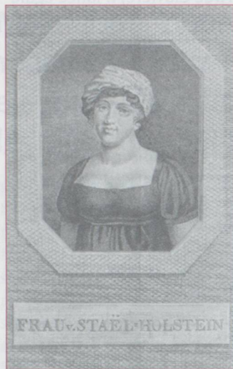
Madame de Staël

ambition incommode, travailleur jusqu'au prodige, propre au succès s'il est possible, victime sans conséquence s'il ne réussit pas; assez enfoncé dans les jacobins