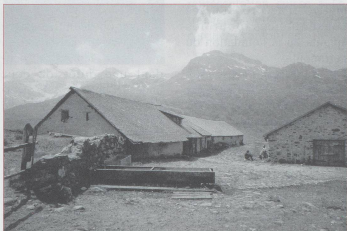
Alp da stretta

Nous parlons toujours moins que nous ne le souhaiterions de la Suisse orientale. Nous vous proposons aujourd'hui de découvrir une vallée peu connue, le Val da Fain. Début d'une série ?