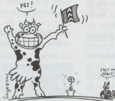
FONDS SUISSE POUR LE PAYSAGE: ÉCOLOGIE URBAINE À NEUCHÂTEL!

■ Créé pour le 700 e anniversaire de la Confédération, le Fonds suisse pour le paysage (FSP) a déjà soutenu plus d'un millier de