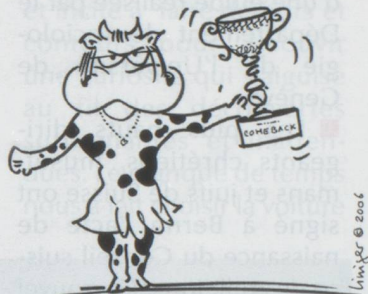
MARTINA HINGIS : OSCAR DU MEILLEUR "COMEBACK"

■ Martina Hingis (25 ans) et Roger Federer (24 ans) ont été honorés à Barcelone, à l'occasion de la 7 e cérémonie des Laureus Sports Awards . La Saint-Galloise a remporté l'Oscar du meilleur comeback de l'année et le Bâlois a été désigné meilleur sportif du monde pour la deuxième fois de suite.