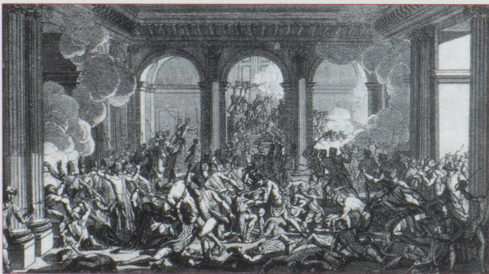
« La journée du 10 août 1792 ou la chute du trône »... Gravure de Carpentier. Musée Carnavalet.

Un Suisse va contribuer à son corps défendant à sceller le sort du roi. Le 21 mai, le journaliste genevois Jacques Mallet du Pan (1749-1800) quitte la France, envoyé en mission par le roi auprès des princes à qui il inspire le fameux manifeste de Brunswick qui menace Paris d'une exécution militaire en cas d'atteinte à la personne royale. Cet ultimatum contre-productif précipite la chute du roi. Dans l'attente de l'arrivée providentielle du général prussien Brunswick à Paris, le régiment des Gardes-Suisses, numériquement affaibli et militairement diminué, n'offre qu'une digue illusoire face au déferlement du flot révolutionnaire. En revanche, la présence des Gardes-Suisses, sorte de 5 e colonne omniprésente au cœur de Paris, alimente une peur propice aux réactions irrationnelles. Ils accréditent le danger contre-révolutionnaire à Paris, préalable obligatoire au renverse-