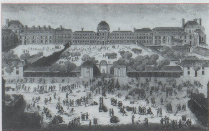
« le 10 août 1792 ». Gravure anonyme, Musée Carnavalet.

L'apathie des cantons suisses durant toute cette période est à tout le moins ahurissante. La dissolution de leur politique étrangère a précédé celle de leurs régiments au service de la France. L'ouverture de la Diète annuelle de Frauenfeld s'effectue le 2 juillet 1792. Elle aurait donc pu prendre les décisions qui s'imposaient pour faire face à des événements trop prévisibles depuis l'humiliation subie par le régiment d'Ernst devenu Watteville. La Diète helvétique ne prit aucune résolution ferme à l'égard des régiments suisses. Le