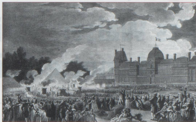
« Pompe funèbre en l'honneur des martyrs de la journée du 10 dans le jardin national le 26 août 1792. Eau-Forte de Helman d'après Charles Monnet. Collection particulière.

Même si les relations économiques subsistent, le cœur n'y est plus.