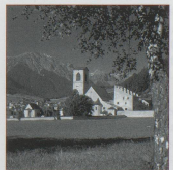
Müstair : le couvent Son Jon.

L'après-midi de cette journée se termine par un tour ferroviaire sur les lignes de chemins de fer du canton d'Appenzell que nos lecteurs connaissent un peu mieux depuis le numéro