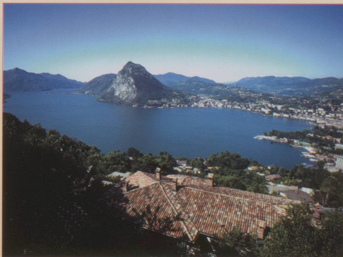
Lugano vue du Monte Bre

Après un petit tour de ville avec, pour changer, un train à pneu, pour admirer les quais de Paradiso à Castagnola et aller prendre le funiculaire du Monte-Bré. Du sommet, la vue sur le lac, la ville et le San Salvatore et les alpes lointaines est époustouflante mais pourquoi avoir fermé sans aucune indication la tour d'observation qui seule permet un regard circulaire. On se remet bien vite de cette légère déception en déjeunant agréablement sur une terrasse