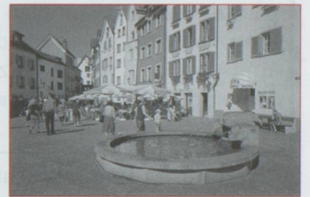
Coire, la vieille ville

Il fallait bien abandonner nos petits trains rouges des chemins de fer rhétiques. Pour aller de Coire à Lugano, la liaison de Tirano à Lugano par les bords du lac de Côme ne se faisant