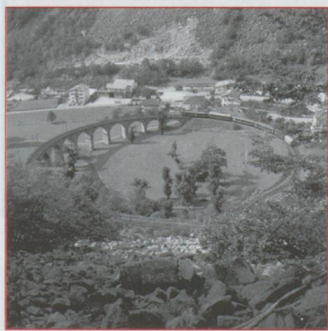
Le viaduc hélicoïdal de Brusio

nées iront franchir les terrifiantes et superbes gorges de la via Mala. Quant à nous, notre train étant si agréable, nous resterons à bord en nous contentant de contempler la rivière située à 990 mètres au-dessous du tablier du pont de Solis et le spectacle géant du viaduc de la Landwasser, mondialement photographié, à la une des plus beaux calendriers, avant d'atteindre la gare de Filisur. Ouvrage d'art unique, en arc de cercle, le viaduc composé de 6 arches élégantes de 20 m d'ouverture, s'engouffre dans le tunnel du même nom percé au milieu de la paroi rocheuse. Un bon conseil : en allant vers l'Engadine, il faut se mettre vers les fenêtres du côté droit. Traversant paysages sauvages, ravins abrupts, forêts primitives, le train poursuit son allure régulière sur un parcours qui devient acrobatique. Entre Bergün et Préda, pour vaincre un dénivelé de 416 m en 12,6 km, il n'y a pas moins de 2 tunnels simples, cinq tunnels hélicoïdaux, 9 viaducs et 2 galeries, ce qui permet de voir le pre-