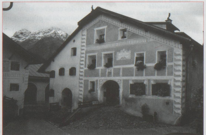
Maison engadine à Guarda

Marcel Proust (Les Plaisirs et les Jours - Les regrets - Rêveries couleur du temps - XXII)