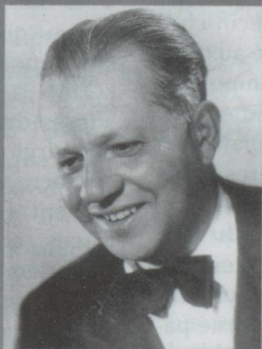
COFFRET 7 COMPACTS