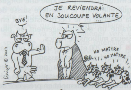
RAËL REFUSÉ EN SUISSE ...

■ En Suisse, un enfant sur cinq a des kilos en trop. La fondation Promotion santé suisse a lancé sa campagne « poids corporel sain », au moyen d'affiches au slogan évocateur : « La Suisse prend du ventre. Alors, on se bouge ? ». Elle veut rendre attentifs les enfants, les adolescents et les adultes aux conséquences d'un surpoids sur la santé. Le surpoids concerne près de 2,3 millions de Suisses. Cette tendance s'avère particulièrement inquiétante chez les jeunes : le nombre d'enfants en surpoids a triplé durant les vingt dernières années. La fondation s'engage en faveur du maintien des heures de gymnastique dans les écoles et pour