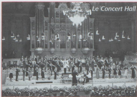
Le Concert Hall

des peintres suisses Anker, Hodler, Segantini, ou Félix Vallotton ou encore 62 sculptures d'Alberto Giacometti. Quant au Musée Rietberg, il abrite des pièces venant des autres continents, surtout d'Inde, de Chine et d'Afrique. Si le classicisme est largement représenté, Zurich est aussi une ville de création, d'avant-garde. Le dadaïsme en est un exemple flagrant.