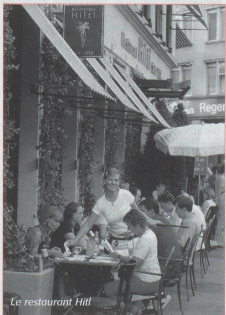
Le restaurant Hiltl

Les bons restaurants sont nombreux et ne servent pas que le délicieux émincé de veau à la zurichoise avec ses röstis dorés et moelleux mais moult spécialités suisses ou du monde entier tant les mélanges ethniques sont vivants dans la métropole. C'est à Zurich que s'est ouvert en 1898 le plus ancien restaurant végétarien d'Europe ; le Hiltl brille par ses plats originaux et créatifs. Il a subi