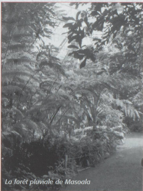
La forêt pluviale de Masoala

Les Zurichois sont très fiers de leur zoo qui le mérite bien. Qu'on est loin de ces parcs où les animaux tournaient sans cesse au fond de cages trop petites ! Ici, fidèle à la nouvelle conception des parcs zoologiques modernes qui se considèrent comme des centres pour la protection de la nature, on a recréé,