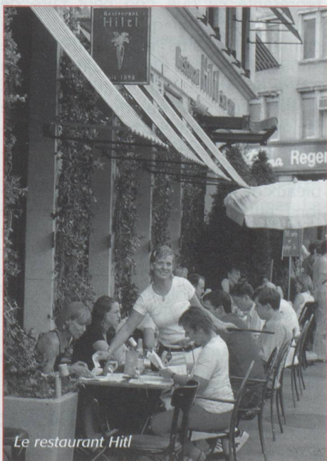
Le restaurant Hiltl

Les bons restaurants sont nombreux et ne servent pas que le délicieux émincé de veau à la zurichoise avec ses röstis dorés et moelleux mais moult spécialités suisses ou du monde entier tant les mélanges ethniques sont vivants dans la métropole. C'est à Zurich que s'est ouvert en 1898 le plus ancien restaurant végétarien d'Europe ; le Hiltl brille par ses plats originaux et créatifs. Il a subi