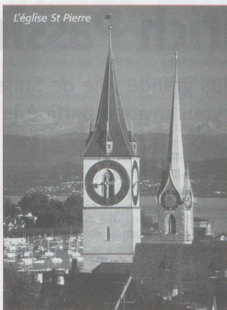
L'église St Pierre

animées, s'honore d'avoir le Zunftthaus zum Meisen , véritable palais baroque de la corporation des marchands de vin, brasseurs et bourelliers qui abrite aujourd'hui une collection de porcelaines et de faïences. En septembre 1946, Winston Churchill s'y rendit pour faire face à la ferveur populaire après avoir prononcé à l'Université son fameux discours en faveur de la réconciliation franco-allemande et de l'unité européenne.