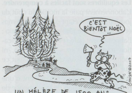
UN MÉLÈZE DE 1500 ANS PLUS VIEIL ARBRE DE LA SUISSE

■ Le plus vieil arbre de Suisse – et peut-être des Alpes – plonge ses racines dans le sol valaisan depuis le tout début du Moyen Âge ! Ce vénérable mélèze –