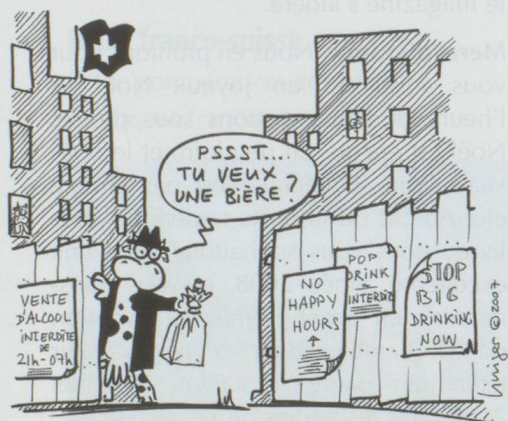
LA PROHIBITION SWISS MADE

■ Importé des pays anglo-saxons, le phénomène du « binge drinking » (autrement dit, se saouler le plus rapidement possible) fait de plus en plus de