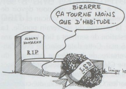
LE PÈRE DU LSD S'EST ÉTEINT

■ Le chimiste suisse Albert Hofmann, connu pour avoir découvert le LSD, s'est éteint à l'âge de 102 ans. Il est décédé à son domicile de Burg im Leimental dans le canton de Bâle. Albert Hofmann avait synthétisé le diéthylamide de l'acide lysergique (LSD) en 1938 lors de recherches médicales pour l'entreprise pharmaceutique Sandoz. Il escomptait initialement en tirer un analeptique mais les expériences ont rapi-