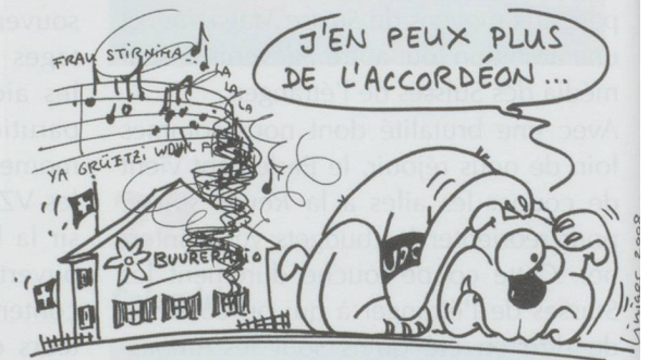
BRUNNER QUITTE BUURERADIO...

■ Le président de l'UDC, Toni Brunner, abandonne le poste de rédacteur en chef de la radio paysanne sur Internet Buureradio , lancée en 2005. La radio est dirigée par une nouvelle équipe qui souhaite se concentrer davantage sur la diffusion de musique folklorique suisse.