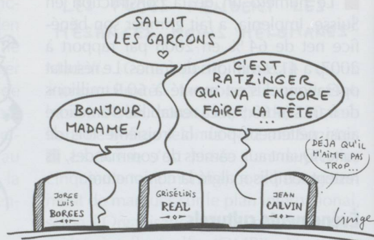
LES "ROIS DE GENÈVE" ACCUEILLENT UNE GRANDE DAME

■ Le diplôme de doctorat obtenu en 1906 à l'Université de Zurich par Albert Einstein sera vendu aux enchères du 10 au 12 juin à Lucerne par la Galerie Fischer. Lors de la même vente, les collectionneurs pourront aussi acquérir le diplôme de docteur Honoris Causa remis au célèbre physicien en juillet 1909 par l'Université de Genève.