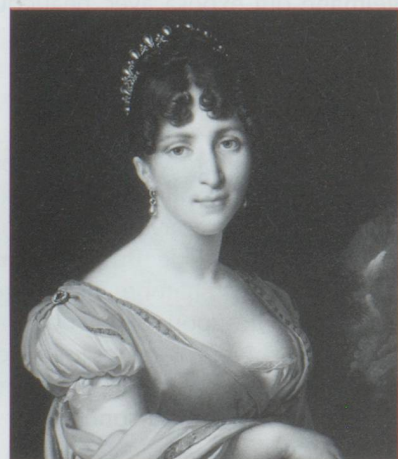
Hortense de Beauharnais

« tournures de petit Suisse » confiera Thiers, « et des yeux sans expression dont on ne saurait dire le contenu » 5 . En novembre 1848, M. de Saint Priest, qui dîna avec Louis Bonaparte chez la princesse Mathilde, le trouve « emprunté et timide, vulgaire de tournure, laid de visage, d'accent suisse très prononcé » 6 . En 1848, Montalembert 7 raillera le « discours de Suisse » à l'assemblée de l'ancien élève du général Dufour, qualifié par Victor Hugo dans L'Histoire d'un crime de « Français né Hollandais et