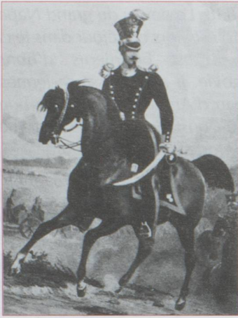
Louis-Napoléon en costume de cavalier

▷ et de prendre contre une puissance étrangère des mesures militaires. La Suisse n'avait retrouvé en 1815 que l'apparence de la souveraineté. En 1838, elle a prouvé qu'elle avait, ce qui est beaucoup plus important, le sentiment de sa dignité, base de toute indépendance réelle ». 17