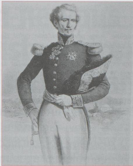
Le général Voirel

qu'il aura été « le seul Suisse à régner sur la France ». Le 10 août 1838, devant le Grand Conseil thurgovien, il confesse qu'il est Suisse puisque « mort civilement » pour la France. Selon Dominic Pedrazzini : « Citoyen suisse, bourgeois d'honneur de Salenstein en Thurgovie, président de la commission scolaire de sa commune, capitaine d'artillerie des milices bernoises, le capitaine Bonaparte, comme on l'appelle en Suisse, reçoit la preuve de l'estime qu'il suscite dans son pays d'adoption lorsqu'au lendemain d'une démarche de l'ambassadeur de France pour le faire expulser, il est élu député au Grand Conseil de Thurgovie (...) Il n'oubliera pas dans la gloire ou l'exil, les belles années passées à l'école de Thoune » 12 . Dominic Pedrazzini remarque qu'« entre 1830 et 1836, le futur général Dufour se chargea de son éducation militaire à Thoune et en fit un capitaine d'artillerie bernois. Ils entretiendront tout au long de leur vie d'excellents rapports de confiance et d'estime. Ce séjour helvétique a inspiré Napoléon III pour ses Considérations politiques et militaires sur la Suisse (1833) » 13 .