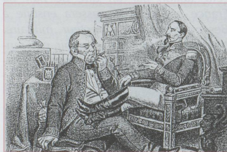
Louis-Napoléon et son ami Kern