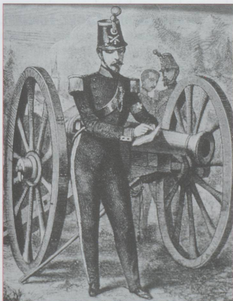
Louis-Napoléon en costume d'artilleur suisse