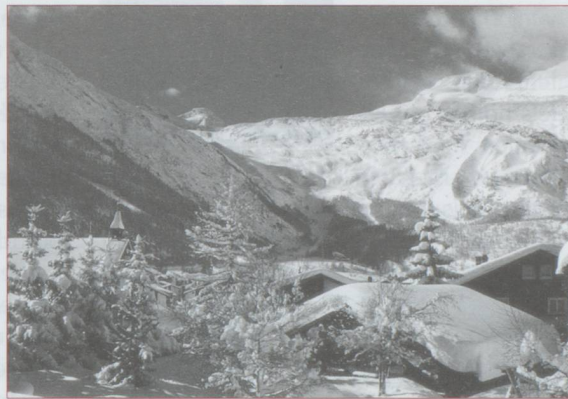
Saas Fee en hiver

Les temps changent ! Voici un petit extrait tiré des guides Joane , édition 1906 : « L'habitude à Louèche est de se baigner dans de grandes piscines carrées d'une profondeur de 1,20 m et pouvant contenir 25 à 30 personnes (sans parler des piscines de famille plus petites). Actuellement les sexes sont séparés dans des bassins différents. Ces derniers sont entourés par une balustrade de bois qui permet aux visiteurs de venir converser