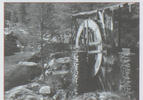
Roue à eau près de Saas Fee

Saas Fee, village sans voiture – il y a un immense parking à l'entrée – a su garder un charme infini. Ensermée dans un écrin brillant de 4000, la station offre une multitude de plaisirs hivernaux ou estivaux : ski sur un glacier tout à côté de crevasses géantes et impressionnantes mais parfaitement sécurisées, descente