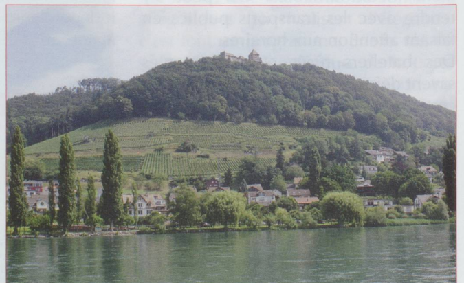
Le château de Hohenklingen

À peine débarqué, on est sous le charme en regardant la place du port, enrubannée et festive. Remontant l'avenue qui jouxte la tour de la sorcière, on arrive bien vite à la porte du bas (Untertor) qui s'ouvre sur la rue principale tout entourée de maisons à colombages, de façades peintes, un véritable festival de couleurs. Tout comme à Schaffhouse, il faut lever les yeux : encorbellements luxueux, enseignes rutilantes, gargouil-