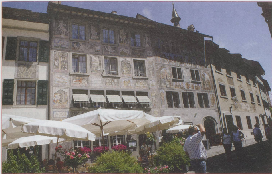
Stein am Rhein : la place de l'Hôtel-de-ville

les terrifiantes, avant-toits enluminés, ardoises vernissées. Mieux que dans la plus exceptionnelle bande dessinée, toute l'histoire s'offre à nos regards émerveillés.