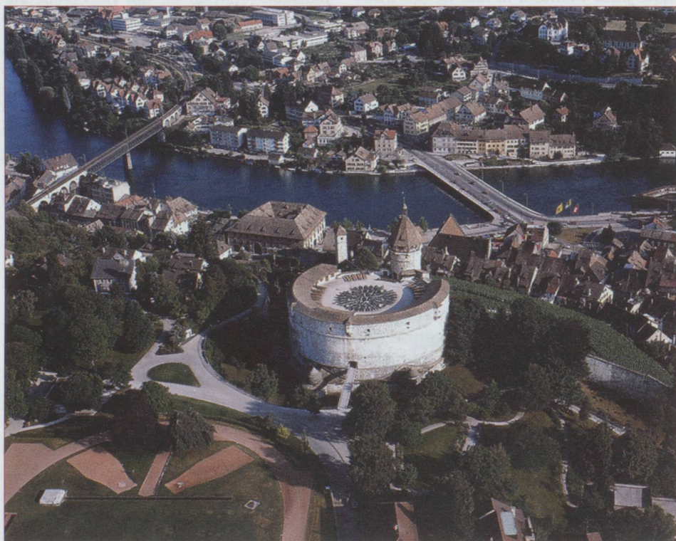
La forteresse du Munot

Afin de ne pas être mauvaise langue, on imagine quelques chats curieux, roulés en boule près des fenêtres en train d'observer, sans en avoir l'air, tout ce qui se passe dans la rue et de faire quelques commentaires sur l'allure des passants. Pour un enchantement visuel, rien de tel qu'une balade dans la vieille ville.