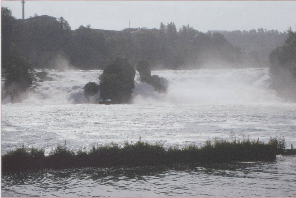
Les chutes du Rhin

Ce ne sont pas celles du Niagara, du Zambèze ou d'Iguaçu mais tout de même les plus grandes d'Europe. Les cataractes du Rhin, ainsi dénommées par Victor Hugo, ébloui, étourdi, bouleversé, terrifié, charmé, représentent un spectacle fascinant.