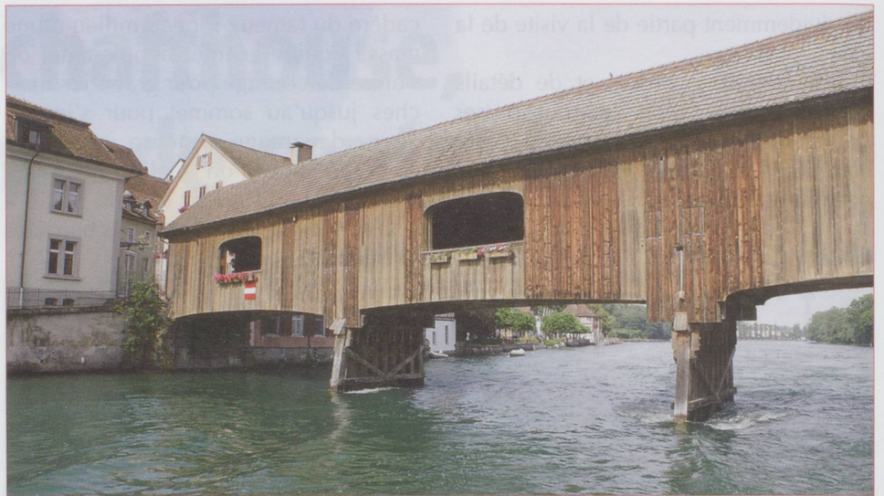
Le pont couvert en bois de Diessenhofen

Le grand orgue fait partie des pièces maîtresses du début du XVIII e siècle. Remanié vers 1840, il perdit son aspect purement baroque pour prendre des allures préromantiques. Entièrement restauré il y a vingt ans, il a retrouvé son aspect d'origine. Et si vous aimez la