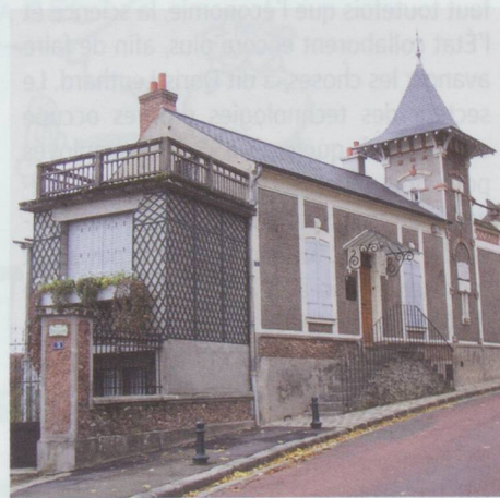
Maison de Ravel à Montfort-l'Amaury

C'est d'ailleurs dans cette villa du « Belvédère » que le compositeur recevait son cercle d'amis intimes parmi lesquels se trouvait un autre célèbre Suisse de l'étranger : Arthur Honegger !