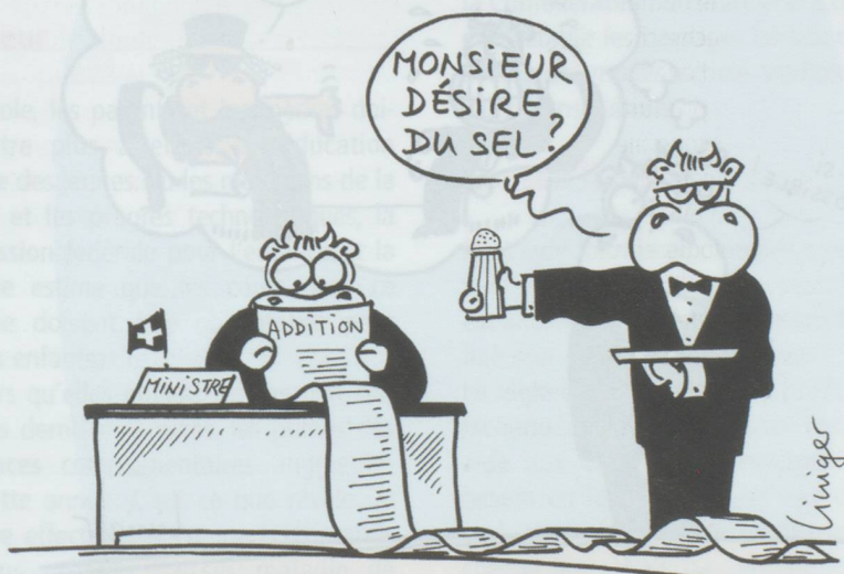
RAPPORT SUR LES TRANSPORTS

■ Le préposé fédéral à la protection des données a saisi le Tribunal administratif fédéral, face au refus de Google de se conformer à ses directives au sujet du service Google Street. Lancé mi-août dernier en Suisse et présent dans 13 autres pays, Google Street permet de visionner les rues des villes grâce à des millions de photos prises par des véhicules du géant de l'informatique. Selon le préposé, il ne s'agit pas d'interdire Google Street mais bien de rendre ce service conforme aux exigences du droit suisse en matière de protection de la vie privée. Selon le préposé, trop de véhicules et de passants sont en effet identifiables sur les photos.