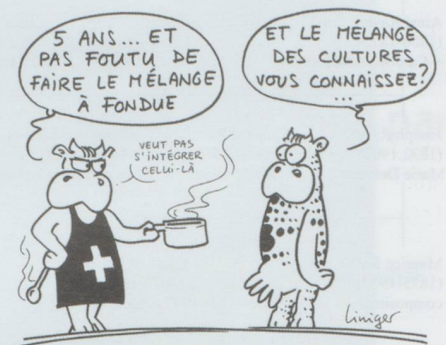
EXPULSER CEUX QUI REFUSENT "MANIFESTEMENT" DE S'INTÉGRER...

■ Le Parlement maintient la pression sur les étrangers. Comme le National, le