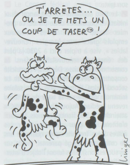
ABUS D'AUTORITÉ : POLICIER PUNI ...

■ Le Tribunal fédéral confirme un verdict de la justice bernoise condamnant un policier à 300 francs d'amende pour abus d'autorité. L'agent avait été dépêché sur les lieux d'une beuverie d'adolescents. L'un deux, passablement éméché, avait agressé ses camarades puis s'était blessé aux lèvres et à l'arcade sourcilière et avait dû être conduit à l'hôpital. Il avait craché sur le policier et lui avait flanqué un coup de pied. Il l'avait aussi injurié au point que