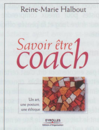
Le dernier livre de Reine-Marie Halbout