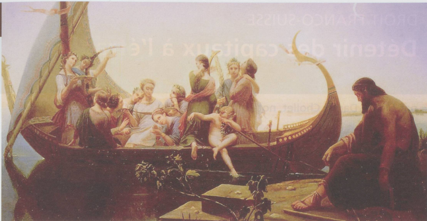
Charles-Marc-Gabriel Gleyre : Le soir ou les illusions perdues