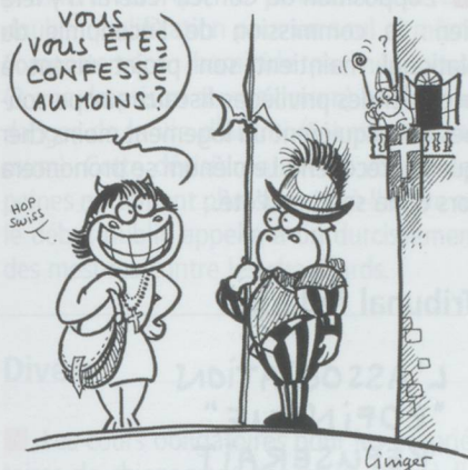
DORIS LEUTHARD RENCONTRE LES NOUVEAUX GARDES SUISSES

■ La Suisse, en tant que médiatrice, espère que le processus de « normalisation » entre la Turquie et l'Arménie se poursuivra. Le Département fédéral des affaires étrangères a exprimé ce souhait après l'annonce par la coalition au pouvoir en Arménie du gel de la ratification des accords signés en octobre 2009 à Zurich.