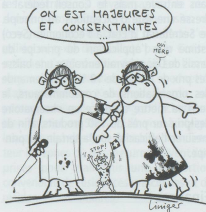
MUTILATIONS GÉNITALES : LA LOI ARRIVE...

■ La Suisse a été soumise aux questions des experts du comité de l'ONU contre la torture. Celles-ci ont porté particulièrement sur le refoulement des demandeurs d'asile, les violences policières et la situation dans les prisons. Le chef de la délégation suisse a réaffirmé au nom de la Suisse « la tolérance zéro envers tout acte de maltraitance et de torture ».