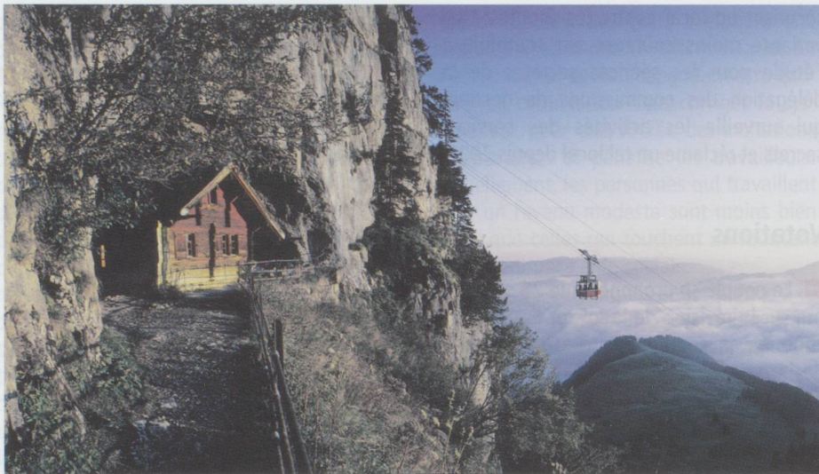
Appenzell : Le Wildkirchli