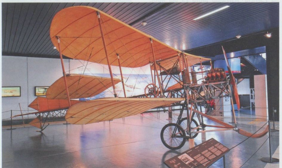
Le Dufaux 4 au musée suisse des transports

Les démonstrations de vol se succèdent en 1910 : les pilotes étalent leur savoir-faire avec plus ou moins de réussite à Viry, dans la région genevoise (onze pilotes dont neuf Suisses y participent du 14 au 21 août), mais aussi à Thoune, Berne, Lucerne, Broc, Avenches et Neuchâtel. Armand Dufaux signe un exploit remarquable : le 28 août, partant de l'embouchure du Rhône, il survole le lac Léman sur toute sa longueur à bord d'un biplan conçu par lui-même et ses frères, pour atterrir sans encombre près de Genève 56 minutes plus tard, après avoir parcouru une distance de 76 kilomètres. C'est un nouveau record du monde :