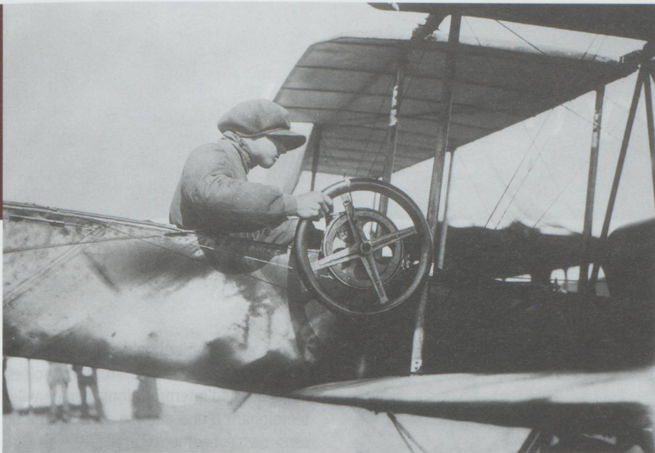
Ernest Failloubaz, Archive AéroRevue

Dufaux parcourt deux fois plus de kilomètres que Blériot, onze mois plus tôt au-dessus de la Manche. Les frères Dufaux sont récompensés de cet exploit par le Conseil fédéral qui leur offre un chronomètre en or portant l'inscription : « De la part du Conseil fédéral aux premiers aviateurs suisses ». Quant au Dufaux-4 , l'avion de l'exploit, il est l'un des quatre plus anciens appareils entiers conservés au monde. Il est exposé pour le bonheur de tous au Musée suisse des transports de Lucerne.