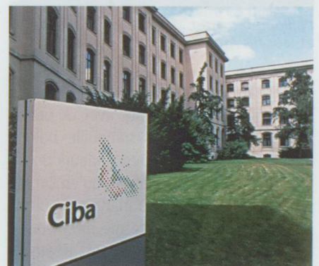
Siège social de Ciba à Bâle

Début 2010 , le nom Ciba disparaît définitivement du paysage des spécialités chimiques suisses. Dans le processus d'intégration au géant chimique allemand, le groupe bâlois apparaît désormais sous l'enseigne BASF Schweiz AG.