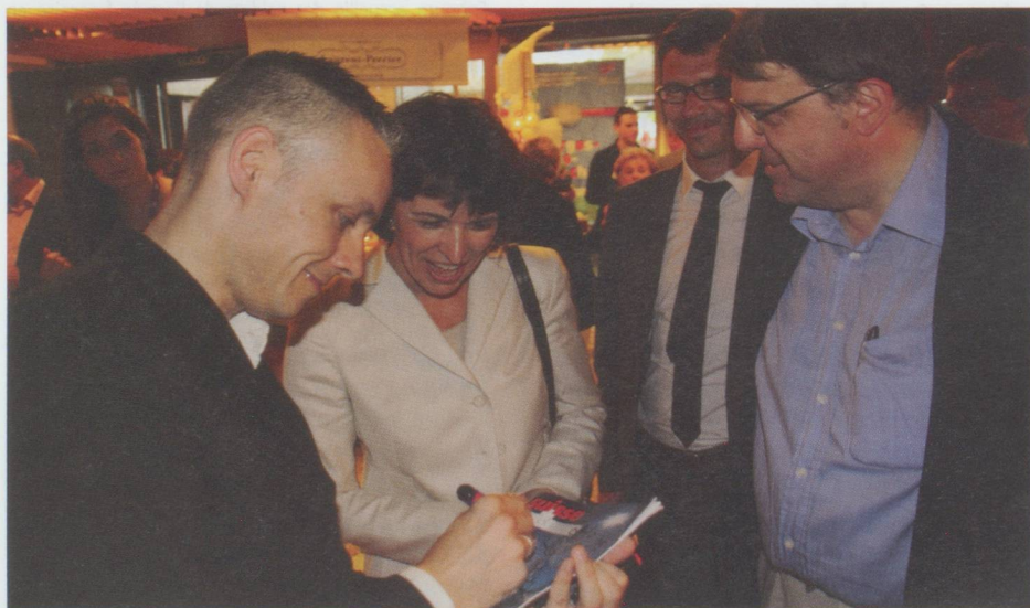
La présidente de la Confédération ne repartira pas sans son Suisse Magazine et son dessin vache