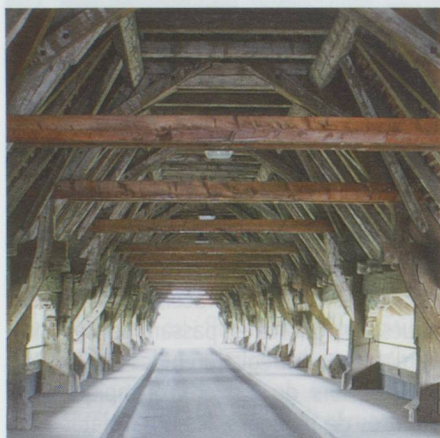
Aarberg : le pont