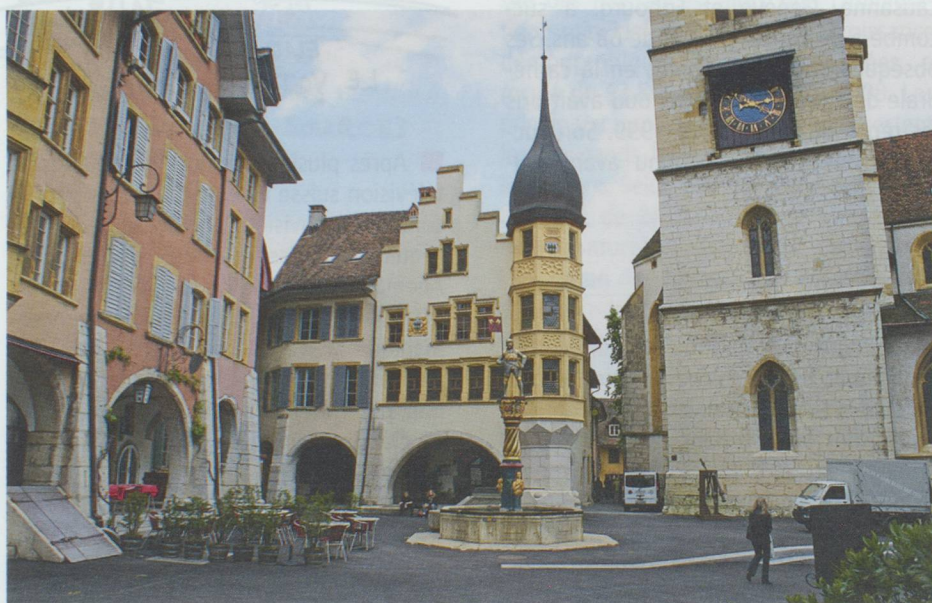
Bienne : la place du Ring

Trait d'union entre la gare et les quartiers commerçants, la place Centrale mérite une mention, car transformée en 2002 en rectangle d'asphalte jaune clair, avec une signalisation douce et non contraignante, elle est devenue un symbole de la cohabitation aimable entre piétons, cyclistes, automobilistes simplement grâce à un petit signe de la main et quelques sourires. Les amateurs d'art déco ne manqueront pas d'aller voir l'hôtel Élite qui, en plus de