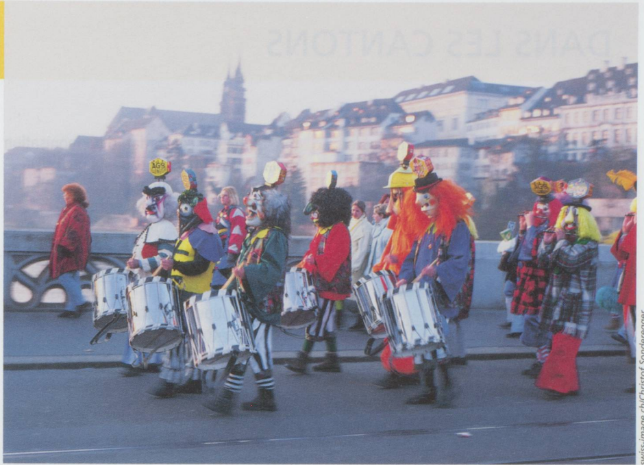
Carnaval de Bâle. Fifres et tambours traversant le pont du Rhin pendant le « charivari ».

■ Seize soldats ont été blessés lors d'une collision impliquant quatre chars de grena-