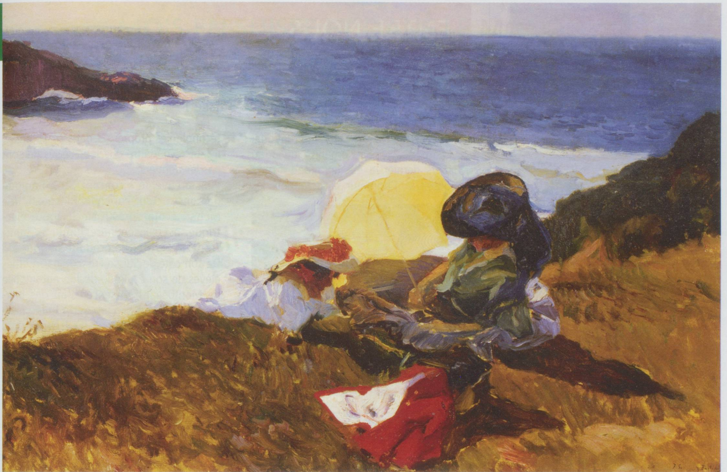
Joaquín Sorolla y Bastida : Soleil couchant, Biarritz, 1906 - huile sur toile, 62 x 94 cm - Coleccion Masaveu - © photo Gonzalo de la Serna Arenillas - Exposition El Modernismo - De Sorolla à Picasso (Lausanne)