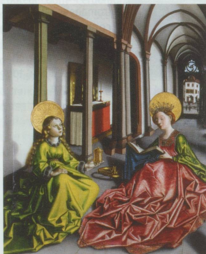
Konrad Witz (um 1400-um 1446) : Heilige Magdalena und Heilige Katharina in einer Kirche , um 1440 - Bild auf Fichte - Blatt : 162 x 130,4 x 0,8 cm - Strasbourg, Musée de l'œuvre Notre Dame - Exposition Konrad Witz (Bâle)

Fondation de l'Hermitage, route du Signal 2, CH-1008 Lausanne. Jusqu'au 29 mai 2011, du mardi au dimanche de 10 h à 18 h, jeudi jusqu'à 21 h.