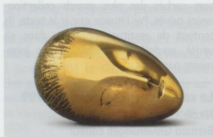
Constantin Brancusi : Muse endormie , 1910 Bronze, 16 x 27,3 x 18,5 cm – Centre Georges Pompidou, Musée national d'art moderne, Paris – Schenkung der Baronin Renée Iraña Frachon - © 2011, ProLitteris Zurich – Foto : © 2011, Adam Rzepka – Exposition Constantin Brancusi und Richard Serra (Bâle)

Fondation Beyeler, Baselstrasse 101, CH-4125 Riehen/Bâle. Jusqu'au 21 août 2011, tous les jours de 10 h à 18 h (mercredi jusqu'à 20 h).