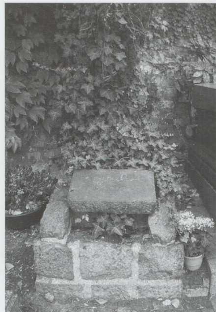
La tombe de Steinlen

Chronique « Ces Suisses qui ont créé la France » n° 37 – En partenariat avec les Archives de la Ville de Fribourg/CH et le Musée franco-suisse de Rueil-Malmaison