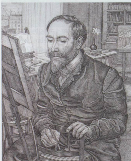
Steinlen par Pieter Dupont

d'emménager successivement au 14 puis au 58 rue des Abbesses. Il s'établira finalement 58 rue Caulaincourt en 1894. Cet humaniste laïque, cet homme révolté que la conservatrice du Musée cantonal des Beaux-Arts de Lausanne, Catherine Lepdor, présente comme « une sorte d'anarchiste pacifiste » a été le « metteur en scène de la vie quotidienne parisienne entre 1880 et 1920 » 1 . Sur la butte Montmartre, il fait connaissance avec tout le petit monde artistique qui y gravite. Il entre en relation avec Frédéric Willette (1857-1926), avec qui l'illustrateur fré-