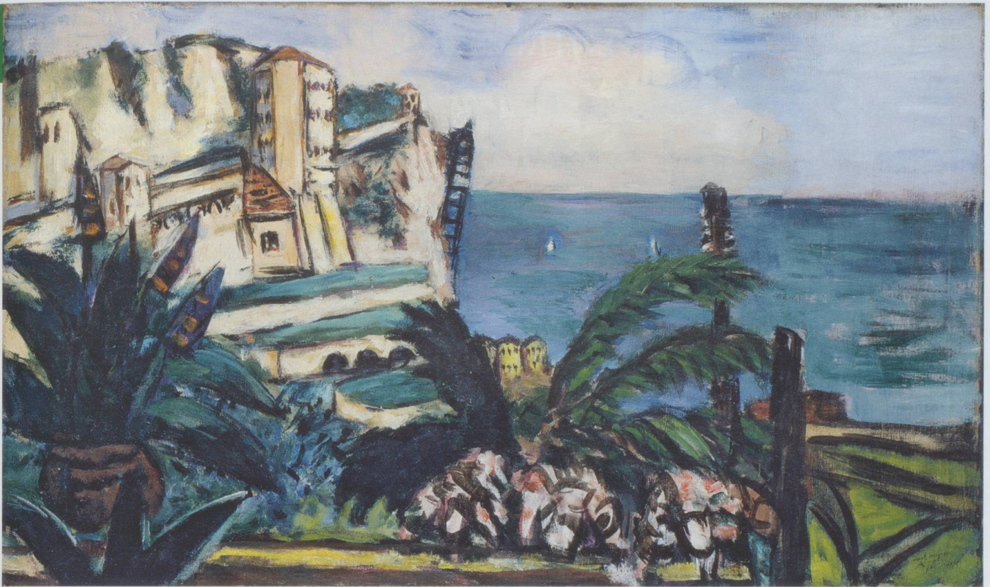
Max Beckmann (1884-1950) : Riviera-Landschaft mit Felsen, 1942 – Öl auf Leinwand – 55,5 x 96 cm – Göpel 594 – Privatbesitz – – Exposition Max Beckmann – Les paysages (Bâle).