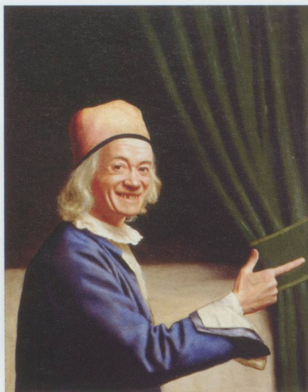
Jean-Étienne Liotard : Liotard riant Vers 1770, Huile sur toile, 84 x 74 cm, Musée d'art et d'histoire, Ville de Genève, inv. N. 1825-11, Exposition Incongru - Quand l'art fait rire (Lausanne)

Musée cantonal des Beaux-Arts, Palais de Rumine, Place de la Riponne 6, CH-1014 Lausanne. Jusqu'au 15 janvier 2012, mardi et mercredi de 11 h à 18 h, jeudi de 11 h à 20 h, du vendredi au dimanche de 11 h à 17 h.