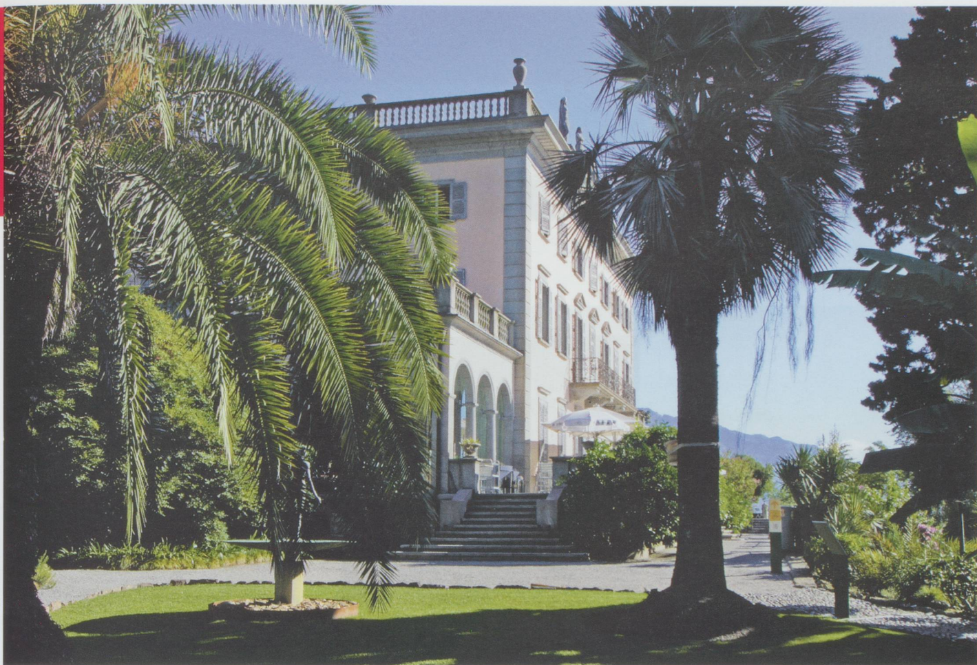
La villa de Brissago

Et pour savourer un panorama sur 360°, voir le point le plus bas de Suisse, le delta de la Maggia et son point le plus élevé, le Mont-Rose, il ne faut qu'un petit coup de télésiège jusqu'à Cimetta. N'oubliez pas vos jumelles.