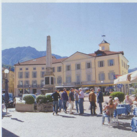
Bellinzona : la place du Théâtre