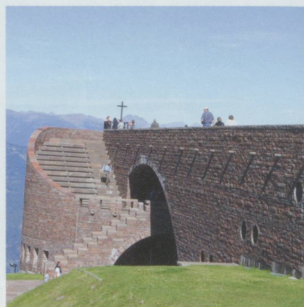
Monte Tamaro : l'église de Botta