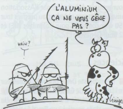
NESPRESSO : CHIFFRE D'AFFAIRES 2011 : 3,5 MILLIARDS DE CHF !

■ Masai Group International, qui fabrique les chaussures physiologiques MBT, est en faillite. La société, qui emploie une cinquantaine de personnes à Winterthour sur un effectif total de 440 salariés, explique ses problèmes par un surendettement et une rude concurrence. Conçues il y a plus de 15 ans par un ingénieur suisse, les chaussures MBT s'inspirent du peuple masai et recréent la sensation de marche pieds nus sur un sol mou, font davantage travailler tous les muscles du corps et redressent la posture avec en sus une diminution des problèmes de dos et d'articulations.