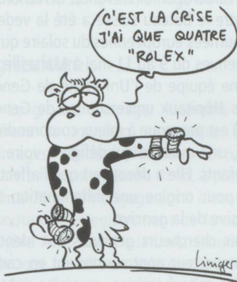
2011 : LE PACTOLE POUR ROLEX

■ L'étude annuelle de la banque Vontobel sur l'horlogerie suisse a livré son verdict. Rolex a engrangé le plus gros chiffre d'affaires en 2011, avec des ventes de près de 4 milliards de francs. Elle devance respectivement Cartier, Omega, Patek Philippe, Longines et TAG Heuer. En ce qui concerne les groupes horlogers, on compte cinq Suisses parmi les dix plus gros chiffres d'affaires de l'an dernier, les trois premières places étant occupées respectivement par Swatch Group, Richemont et Rolex.