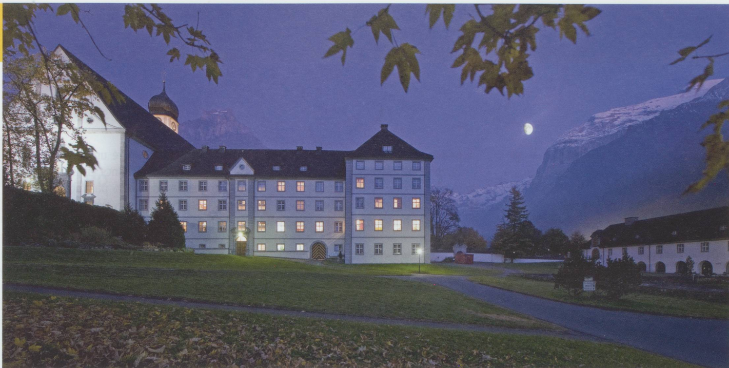
Le monastère d'Engelberg (OW)

■ Le canton de Genève devra payer 12 millions de francs de plus que cette année pour aider les cantons moins favorisés, au titre de la péréquation financière 2013. La facture genevoise se montera à 258 millions de francs.