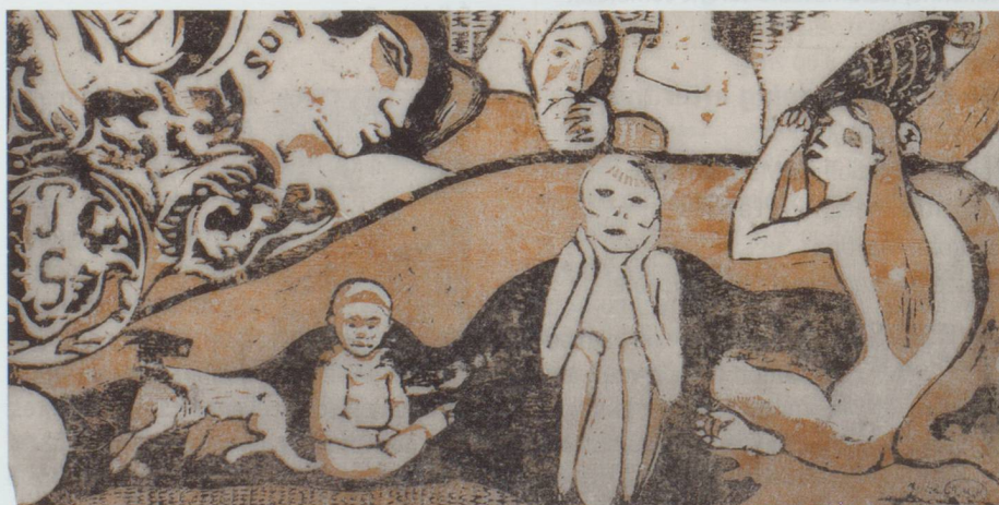
Paul Gauguin : Soyez amoureuses, vous serez heureuses (Liebt, ihr werdet glücklich sein) , 1898. Holzchnitt, Bild: 15,8 x 26,2 cm - Privatsammlung - Exposition Paul Gauguin : L'Œuvre gravé, Zurich

Fondation de l'Hermitage, route du Signal 2, CH-1008 Lausanne. Du 9 novembre au 16 décembre 2012, du mardi au dimanche de 10 h à 18 h, jeudi jusqu'à 21 h.