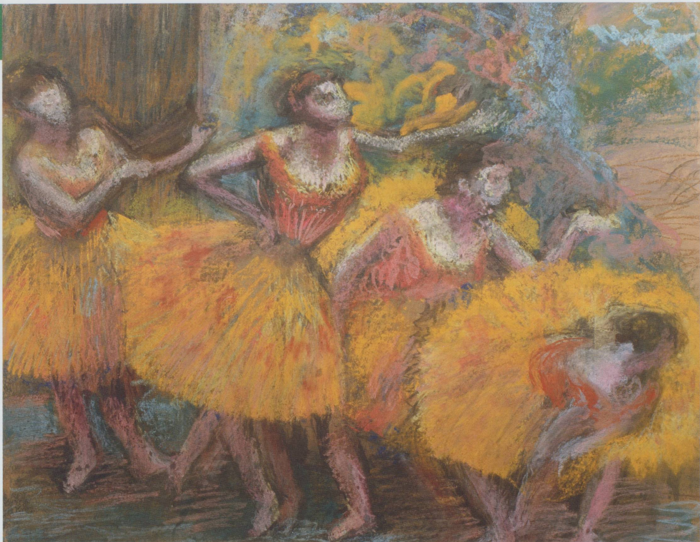
Edgar Degas : Danseuses aux jupes jaunes , 1903 – Pastel, 82 x 92 cm – Collection privée, Courtesy M.S.F.A. - Photo: Courtesy M.S.F.A. - Exposition Edgar Degas, Fondation Beyeler, Bâle