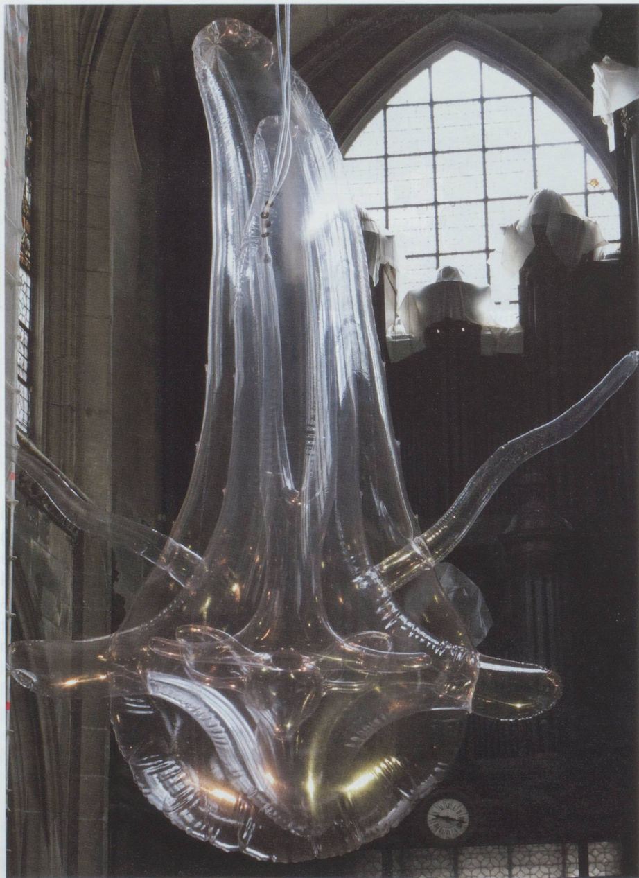
chimAir 2 - Victorine Müller - Église Saint-Merri, Paris 2012 - PVC, 750 x 600 x 200 cm

Je ne fais aucune maquette miniature, car elles ne me permettent ni d'appréhender les difficultés de réalisation, ni de me projeter dans le rapport d'échelle sculpture/spectateur. Je fais toujours quelques cro-