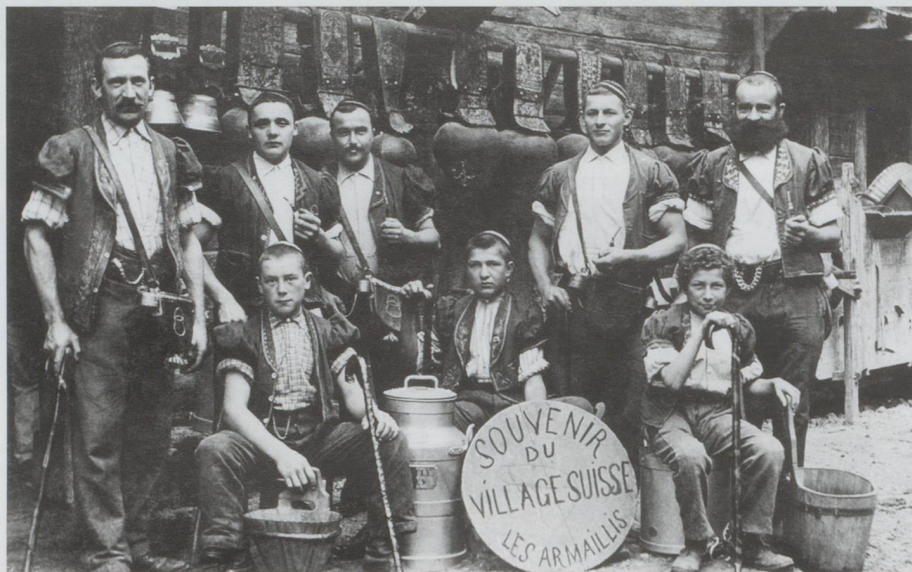
Un groupe d'armaillis à l'exposition universelle de Paris en 1900. Cette photographie est présentée dans le parcours permanent du Musée gruérien de Bulle (Suisse), La Gruyère. Itinéraires et empreintes

Pour mémoire, rappelons que Louis-Jules Allemand est un architecte paysagiste suisse décédé à Genève en décembre 1916. Il est l'auteur, seul ou en collaboration avec d'autres architectes paysagistes comme Henry Correvon (le jardin alpin de l'expo-