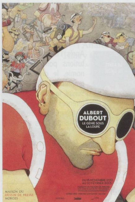
Exposition Albert Dubout - Le Génie sous la loupe, Morges