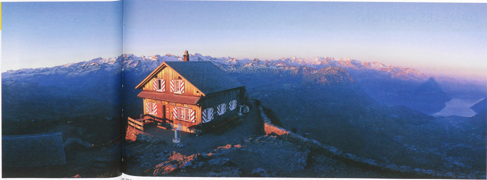
Lumière du matin sur le restaurant du Grand Mythen (1 899 m), dans le canton de Schwyz

■ Une motion populaire intitulée « Maintien de l'hôpital de Tavel dans sa fonction actuelle » a été déposée au secrétariat du Grand Conseil fribourgeois. Elle était munie de 327 signatures, soit à peine plus que les 300 requises.