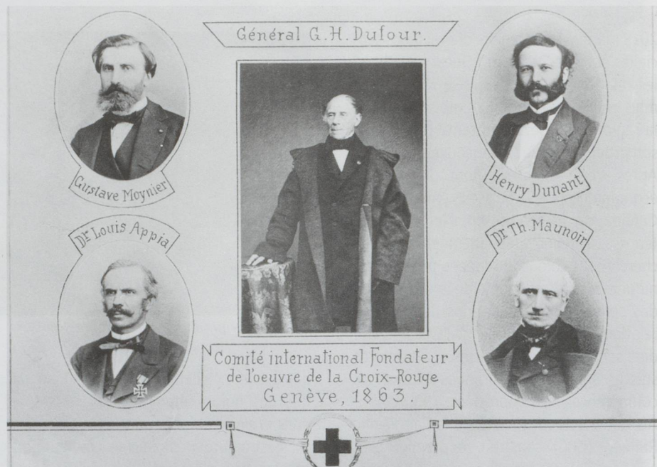
Les cinq fondateurs du CICR

Et le livre rencontre intérêt et sympathie. C'est ainsi qu'au début de 1863, Henry Dunant est invité à parler de son projet par le président de la Société genevoise d'utilité publique, Gustave Moynier. Huit jours plus tard, le 17 février, est créé le Comité inter-