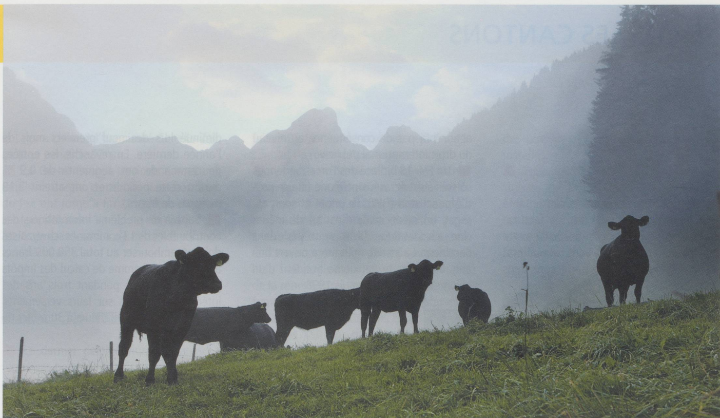
Vaches en train de paître près de Gérignoz au Pays-d'Enhaut (VD), à l'arrière-plan, la Gummfluh, 2 458 m