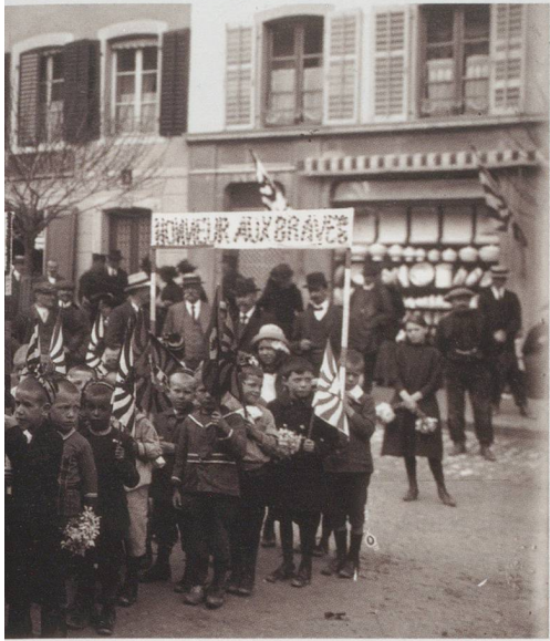
Musée gruérien, Bulle