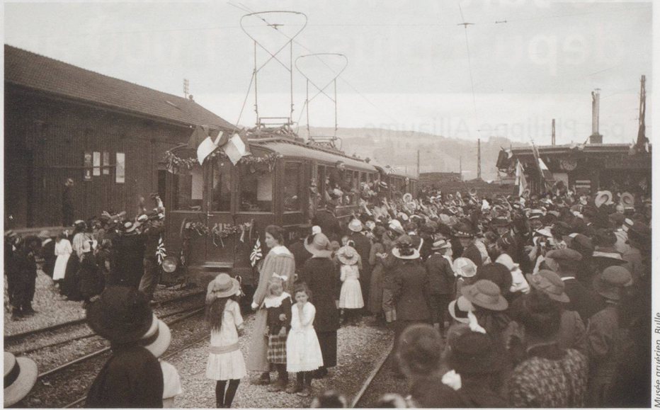
Musée gruérien, Bulle