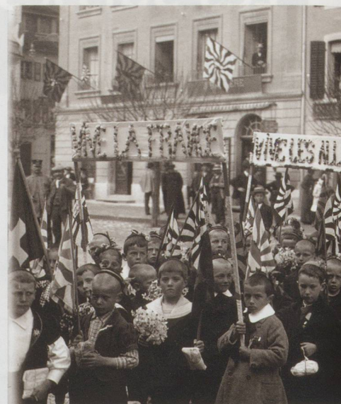
Armistice de 1918 à Bulle.

Visite du général Pau à Bulle le 12 juin 1917.