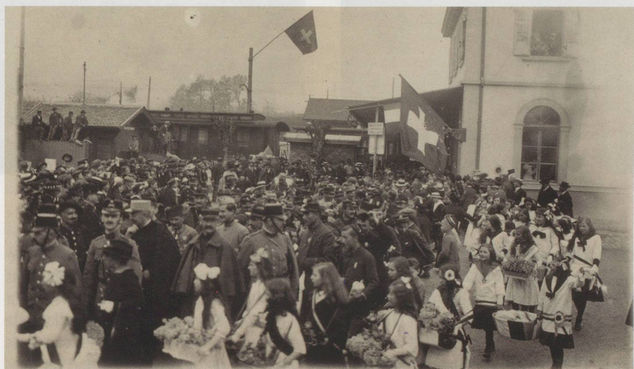
Musée gruérien, Bulle