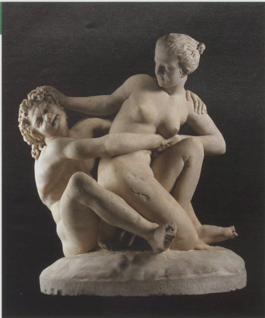
Nymphe et satyre : Marbre, groupe représentant une nymphe – dont la tête a été restaurée au XIX e s. – repoussant les assauts d'un satyre. Période romaine, II e s. apr. J.-C., trouvé près de Tivoli (Latium).

Exposition La beauté du corps dans l'Antiquité grecque, Martigny.