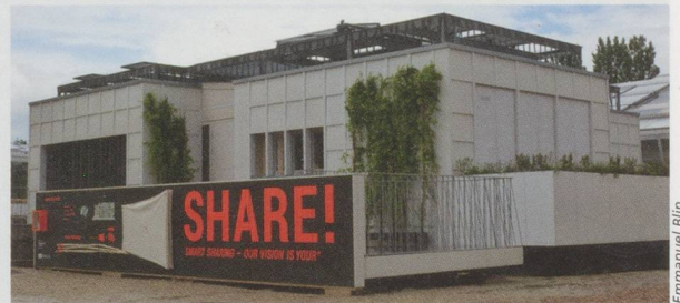
La maison « your+ » du Team Lucerne.