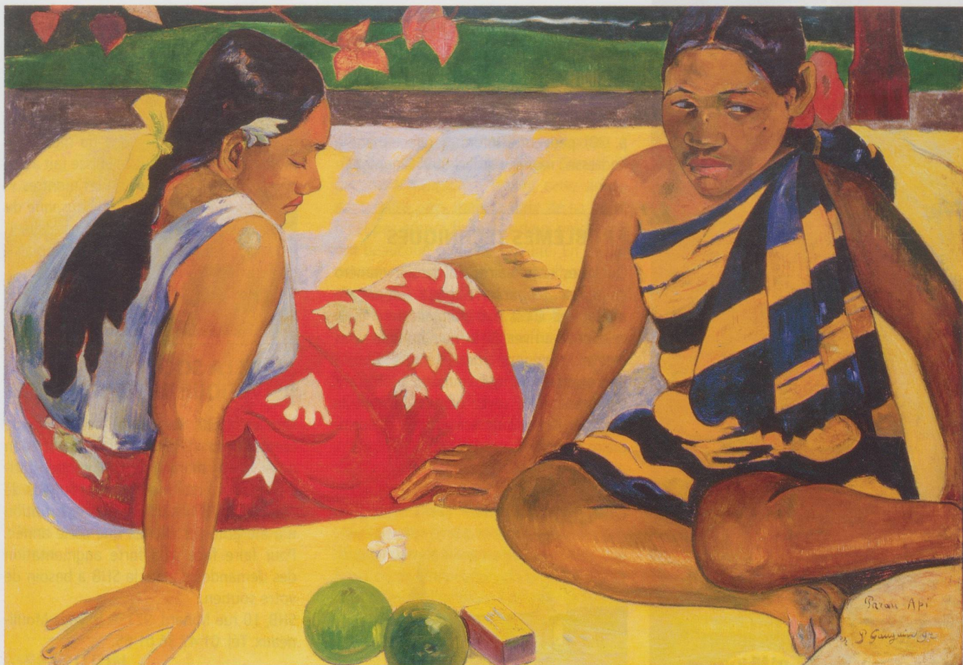
Paul Gauguin, Parau api, 1892, Quelles nouvelles ? Huile sur toile, 67 x 91 cm, Gemäldegalerie Neue Meister, Staatliche Kunstsammlungen Dresden.