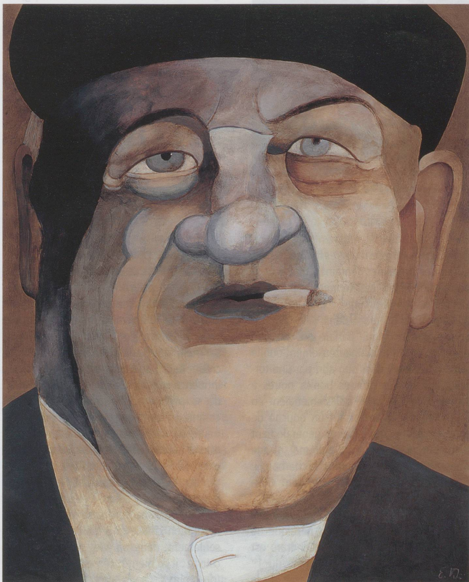
Blaise Cendrars, par Etienne Delessert.

La Première Guerre mondiale fut une abominable boucherie. À titre de comparaison : douze ans de guerre d'Afghanistan, soit 88 morts pour la France, représentent 22 minutes de la Guerre de 14 1 . De grands auteurs s'y sont brisés, nous laissant orphelins de leurs œuvres, tels Charles Péguy ou Alain-Fournier. Le Neuchâtelois Blaise Cendrars y laissa juste son bras ainsi que toutes ses illusions.