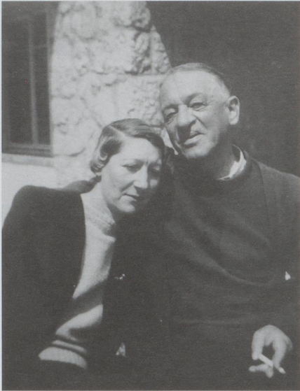
Cendrars et Raymone à Saint-Segond, 1949.