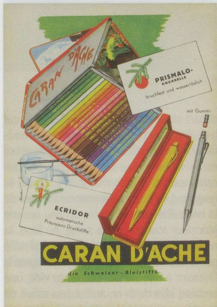
Caran d'Ache/Benoît Linero