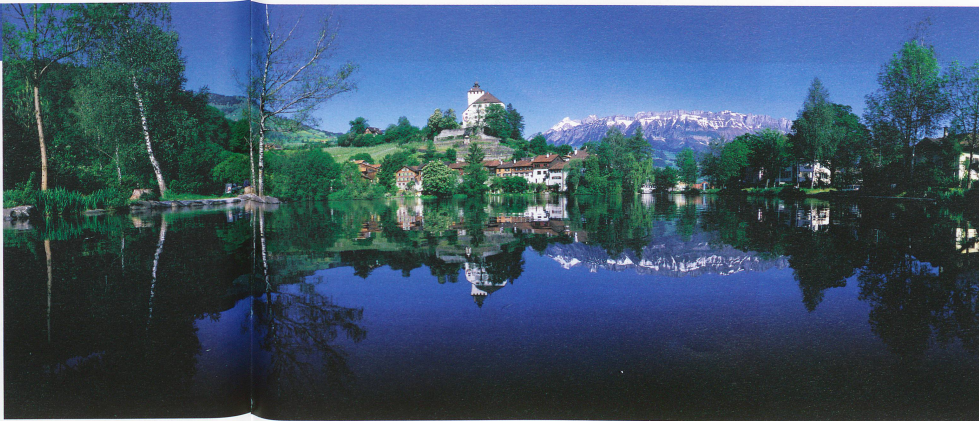
Château et petite cité de Werdenberg (XIII e s.) dans le Rheintal saint-gallois.