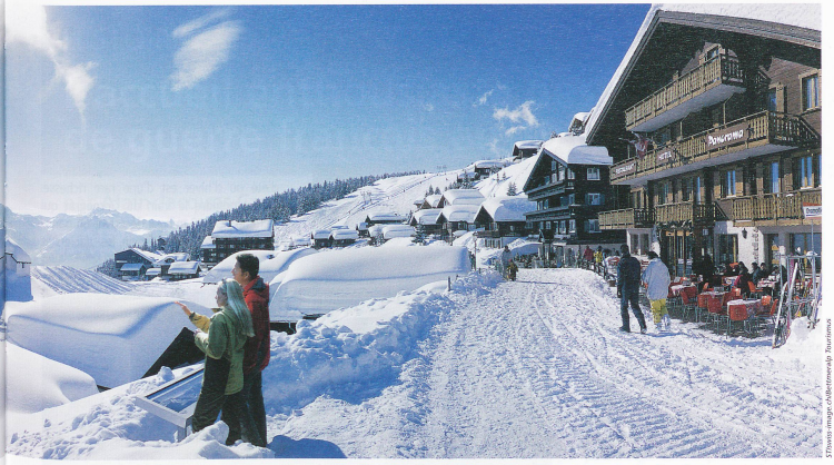
Bettmeralp (1950 m), station sans voiture surplombant la vallée du Rhône en Valais. En arrière-plan la chapelle Ste-Marie-de-la-Neige.

l'année, c'est un ancien hameau fondé par les Walsers, devenu village de montagne plein de charme et de tranquillité, posé sur un plateau surplombant la vallée de Lauterbrunnen. Celle-ci est célèbre par ses nombreuses cascades et les tonitruantes chutes souterraines de Trummelbach. Elle offre une vue unique sur le sublime trio des Alpes bernoises.