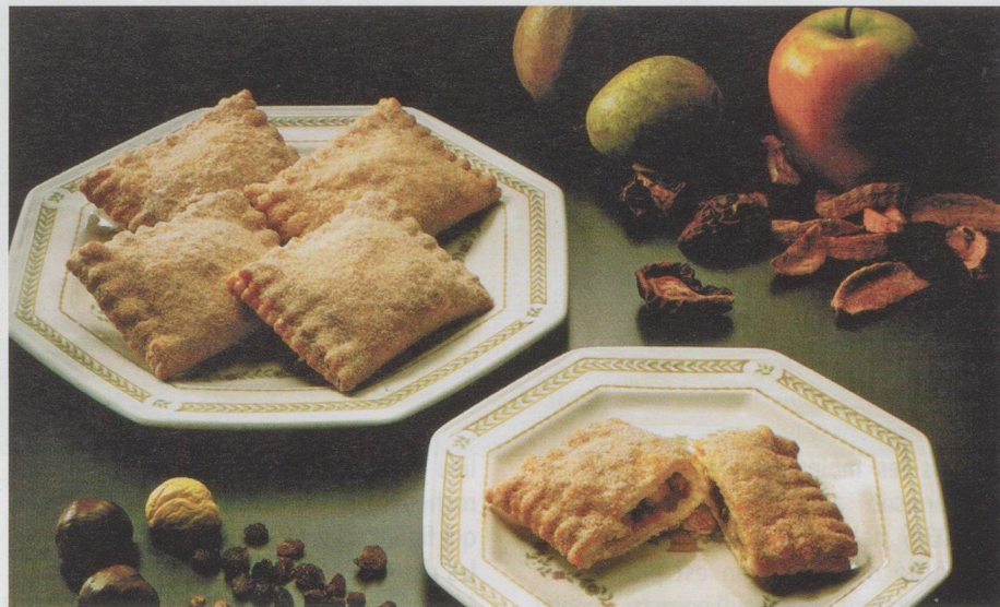
Pro Gastronomía, une Fondation Nestlé

Préparation : Colorer la viande dans la graisse et laisser suer 10 min. Assaisonner. Faire suer les oignons et les légumes,